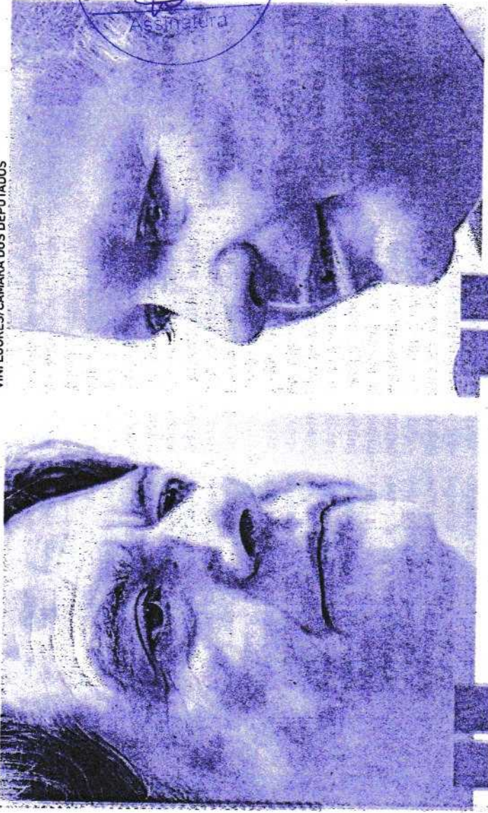
VINI LOURES/CÂMARA DOS DEPUTADOS

COMISSÃO DE LICITAÇÃO Fls. 2526 Assinatura