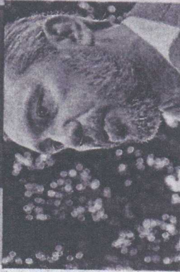
ELMANO de Freitas deve reproduzir no Estado o esquema de ministérios de Lula